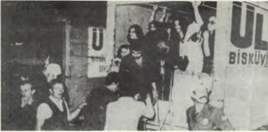
Polis, çoğu kadın olan grevcileri karçkola patronun arabasıyla götürdü.